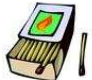
Une boîte d'allumettes